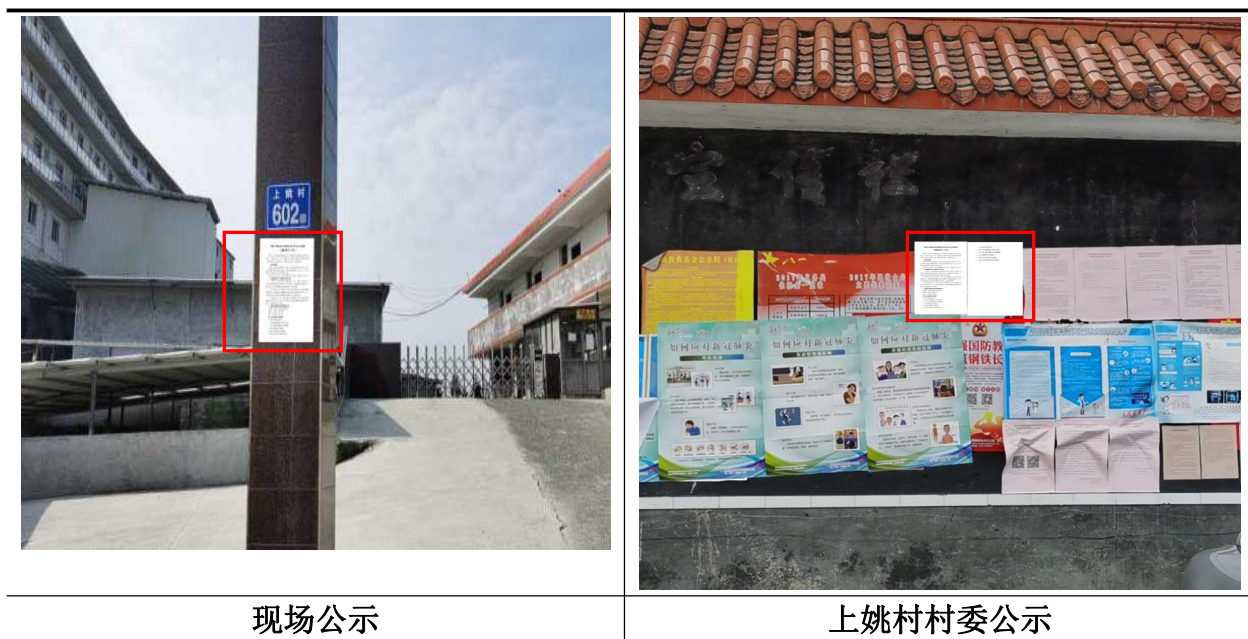
图 2-2 第一次张贴公示现场