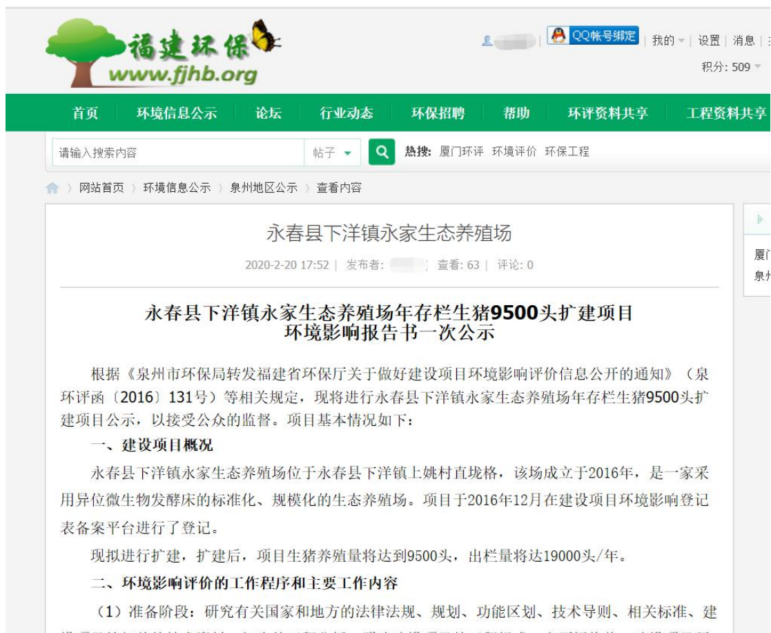
图 2-1 第一次网络公示截图