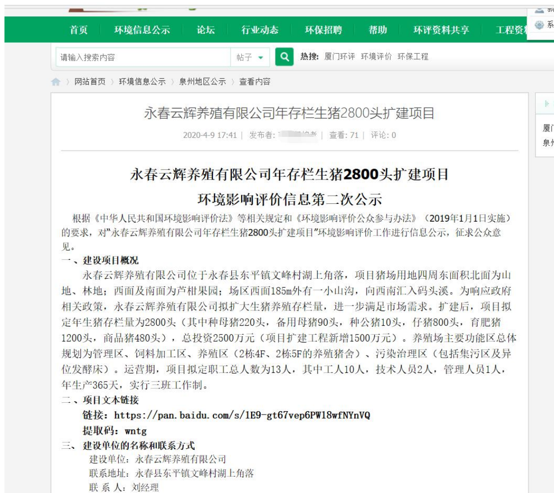
图 3-1 第二次网络公示截图（报告全本）