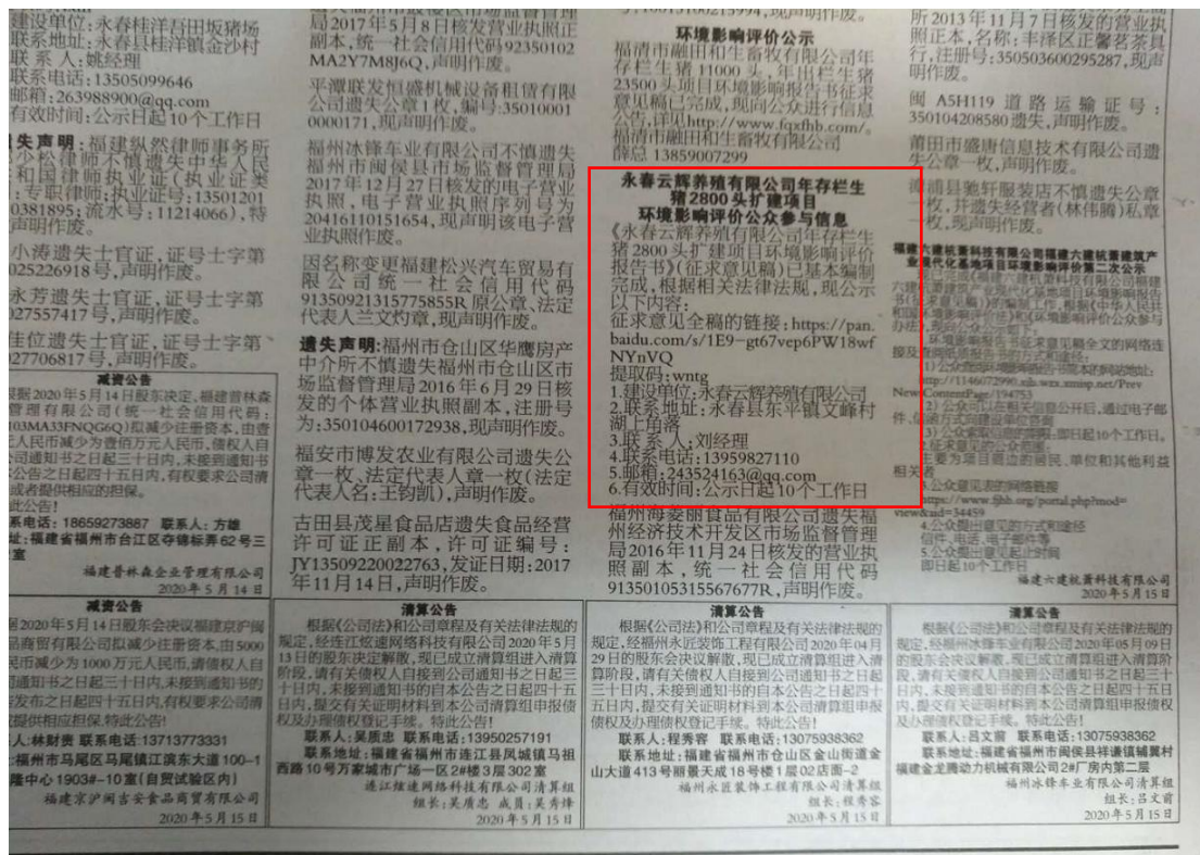
图 3-3 第二次登报公示