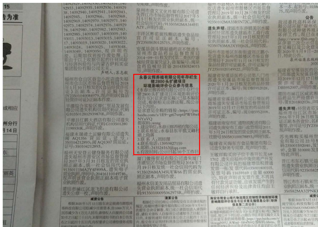
图 3-2 第一次登报公示