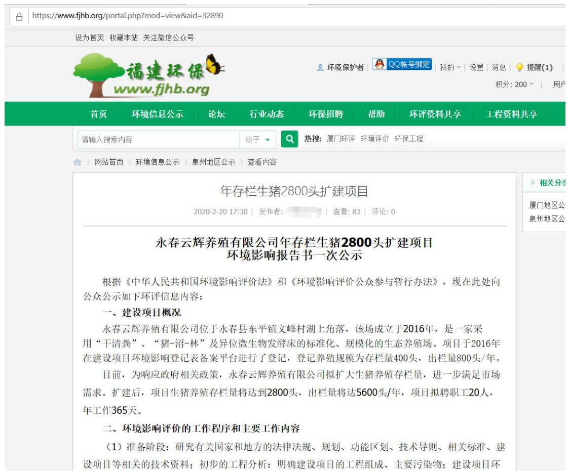
图 2-1 第一次网络公示截图