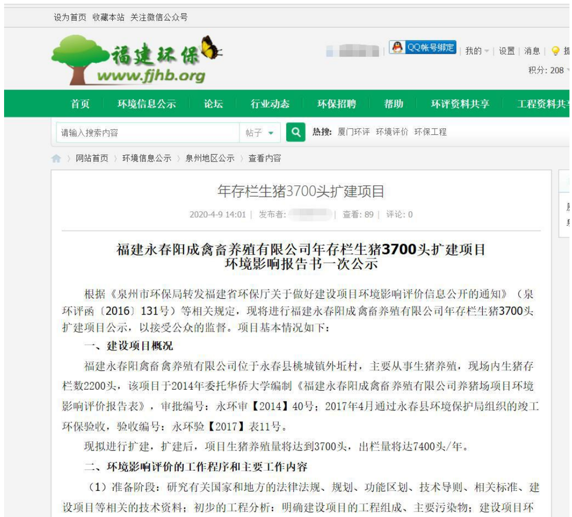
图 2-1 第一次网络公示截图