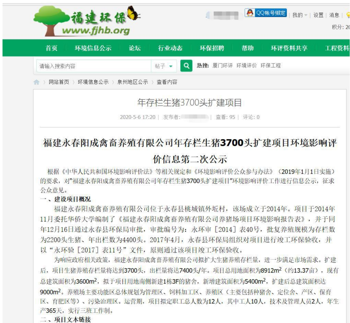
图 3-1 第二次网络公示截图（报告全本）